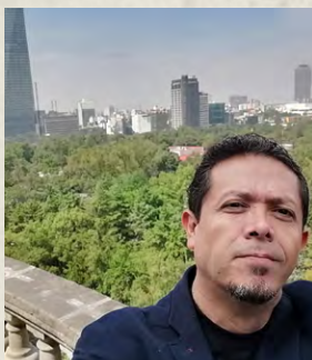
Director General, Instituto Corazón de la Tierra (ICT), México ( corazondelatierra@gmail.com )