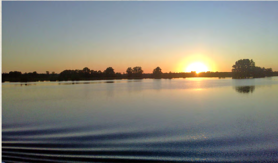
Figura 1. Los lagos son ecosistemas de importancia mundial. Lago Chapala, México.

responsabilidades institucionales, b) desarrollo de políticas de manejo adecuadas, c) participación de los sectores interesados, d) uso de Información científica y tradicional, e) aprovechamiento adecuado de la tecnología, y f) flujo correcto de financiamiento. El ILBM está diseñado para que los sectores interesados que habitan o utilizan la cuenca, de forma colectiva y realista, atiendan las causas de la problemática a través de acuerdos y actividades conjuntas, mejorando los componentes de gobernanza a través del tiempo (ILEC, 2007).