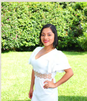
Técnico ambiental, Instituto Corazón de la Tierra (ICT), México ( sigmapas@gmail.com )